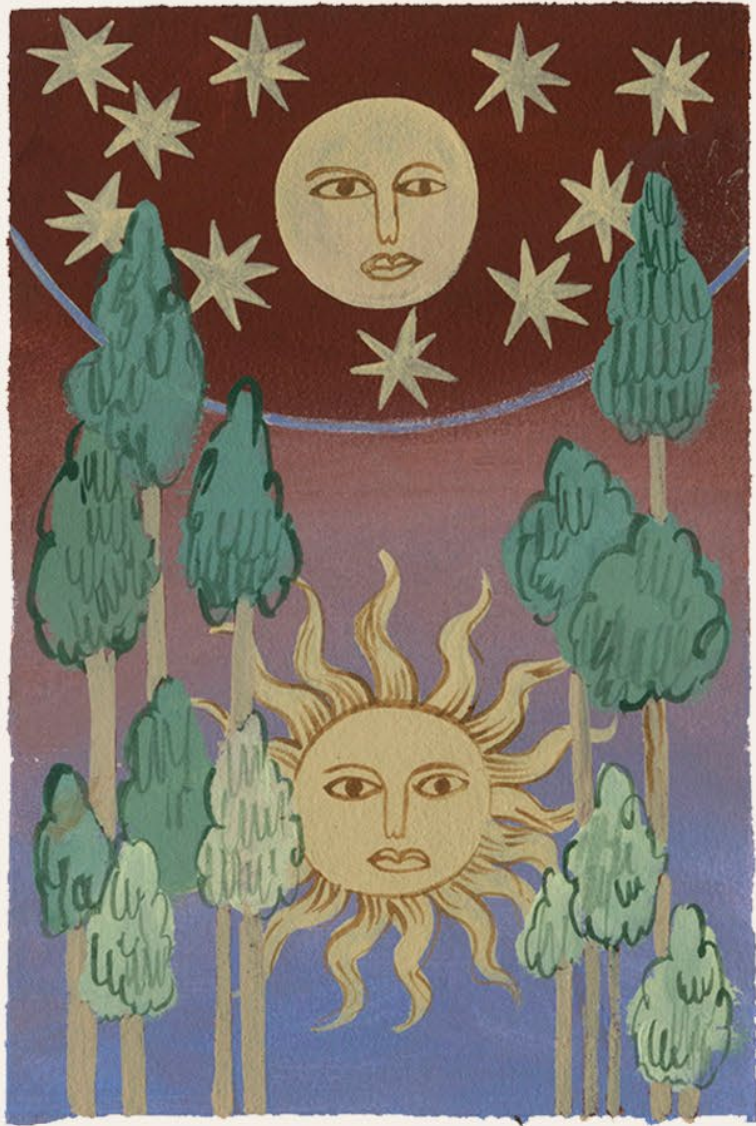
LE GRAND MAZARIN